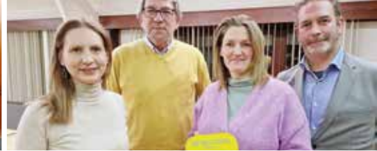
De gele doos in het Hageland (p. 3)