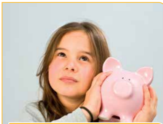
Als dit meisje in Scherpenheuvel-Zichem zou wonen, droeg ze nu al 2 500 euro schuld.