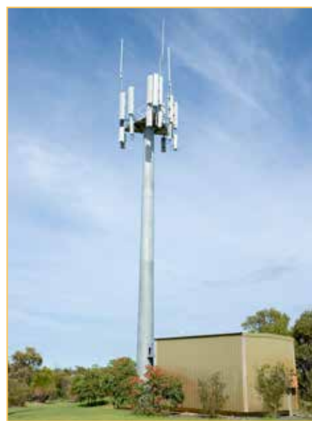
Siert soortgelijke mast straks de skyline van Scherpenheuvel?